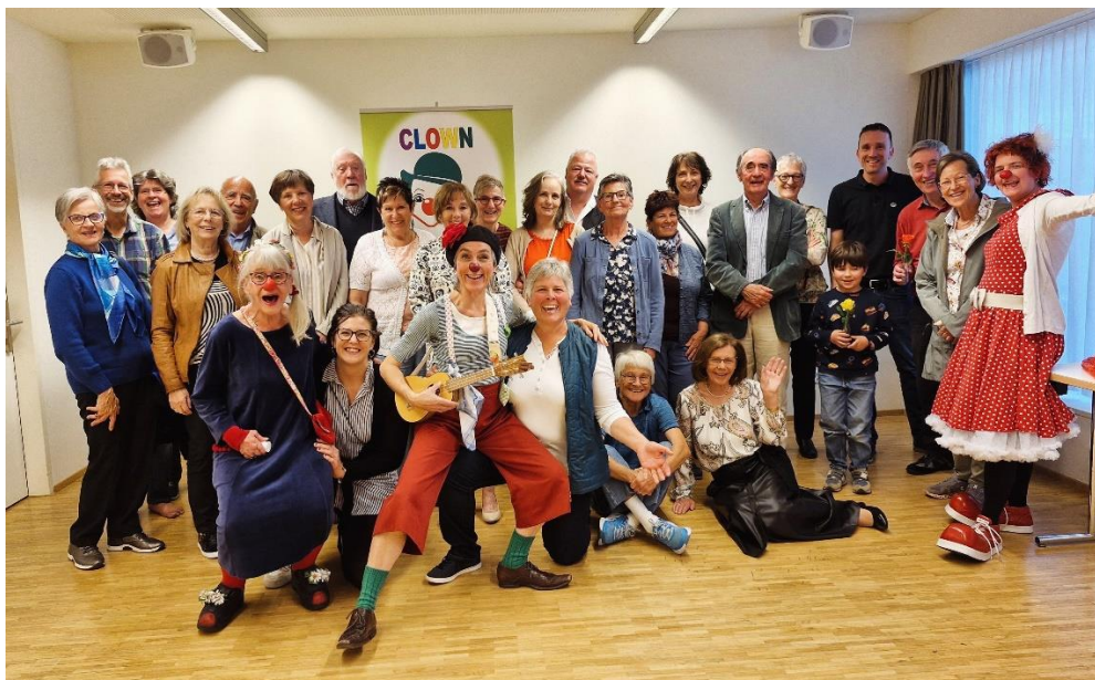
Abbildung 1: Gut gelaunt starten die Mitglieder, Gäste, der Vorstand und die Clowns nach der GV vom 5. Mai 2024 mit vereinten Kräften ins neue Vereinsjahr 2024-2025.

Am Sonntag 5. Mai 2024, am Weltlachtag, treffen wir uns im Martinsheim in Visp zur 13. GV. Das Protokoll, der Jahres- und Revisorenbericht, die Rechnung und das Budget mit den Anpassungen zur Höhe der Beteiligung bei den Clown Einsätzen und den Sparmassnahmen werden angenommen. Wir starten vorsichtig, aber optimistisch in das 14. Vereinsjahr. Unser Ziel: Die vereinbarten Clownvisiten für das kommende Vereinsjahr finanzieren zu können.