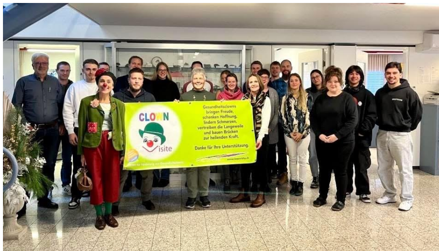
Abbildung 12: Verantwortliche und Belegschaft der SRP Ingenieure AG in Brig