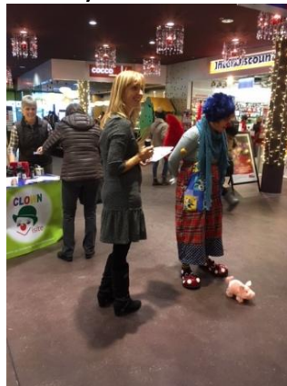
Aktion im Centerpark Visp