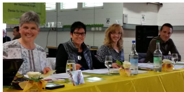
Heitere Stimmung an der GV 2017 im Zeughaus Kultur in Glis